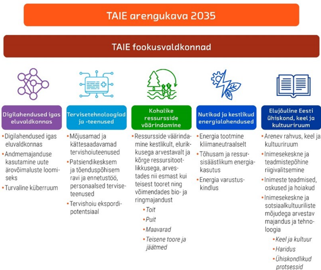
Joonis 3. TAIE fookusvaldkonnad ja nutika spetsialiseerumise valdkonnad.